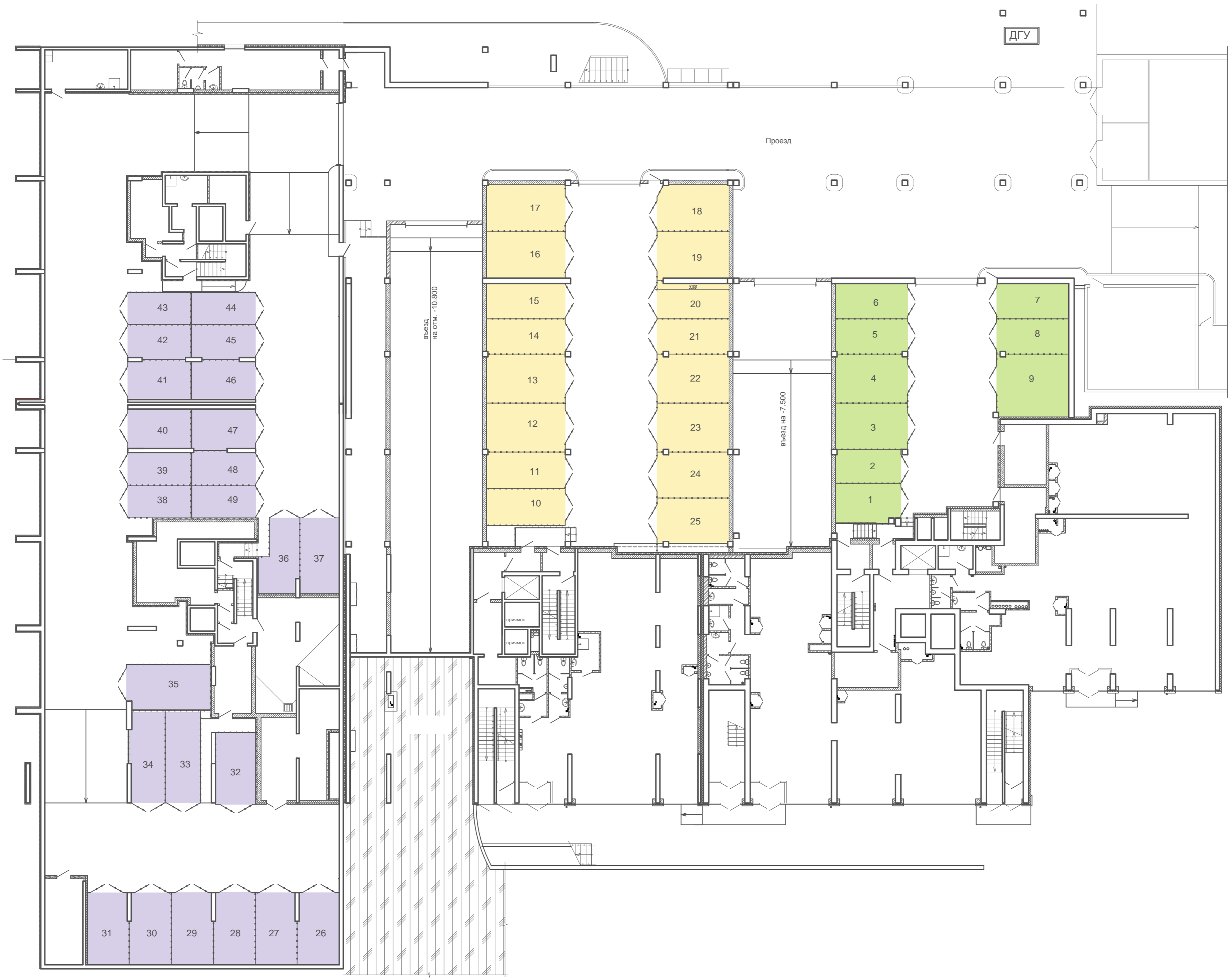
План автостоянок на отм. -4.200 ... -5.100